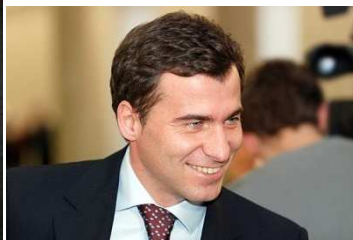
7 4041 011 251 Wojciech Olejniczak 729 8 Żyd