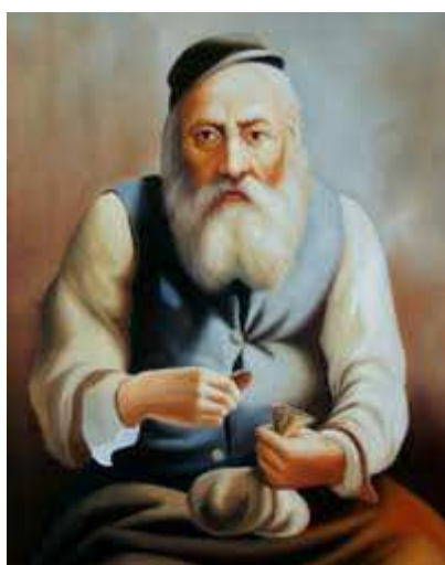
Żyd liczący pieniądze