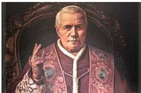
Św. Papież Pius X (Polak)

ŻYDZI – osoby wywodzące się z Narodu Żydowskiego, nie są pochodzenia polskiego.