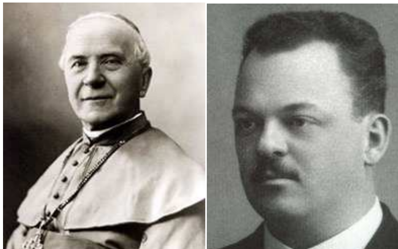
Święty Józef Sebastian Pelczar Gideon Sundback