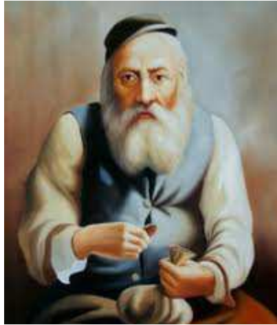
Żyd liczący pieniądze